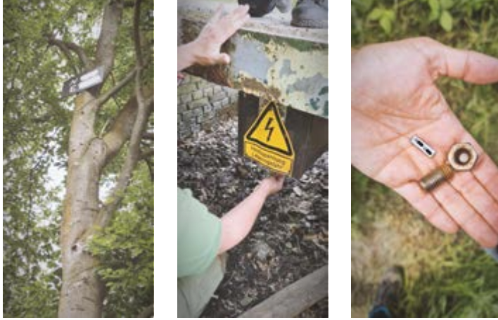
VERSTECKT UND »GEFAKET« Links: Koordinaten in Bäumen, die man oft nur mit dem Fernglas ausfindig machen kann. Mitte: Versteckstation unter einer Brücke. Rechts: Eine typische Fake-Schraube.