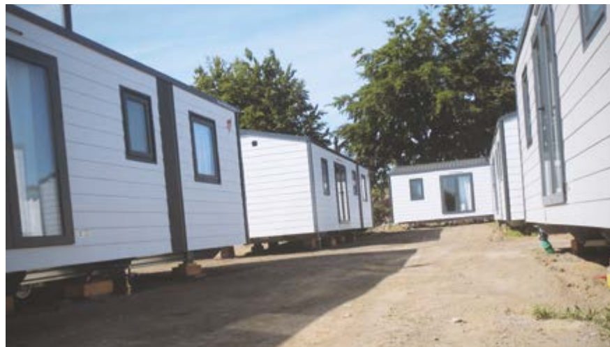
SCHNELL BEZOGEN Die neuen Chalets waren innerhalb weniger Tage belegt.