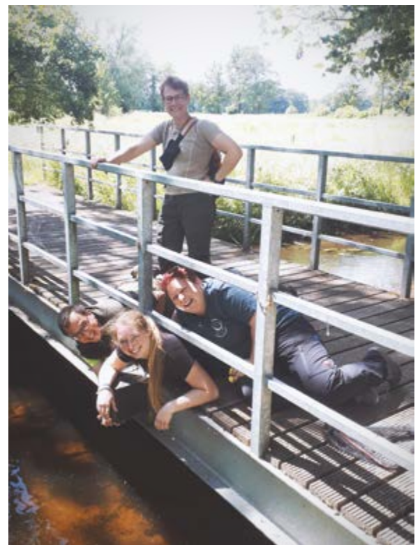
VOLLER KÖRPEREINSATZ Beim Lösen der Rätsel durchaus oft gefragt

Geocaching ist ein Hobby, was man auf der ganzen Welt spielen kann, es gibt kaum Orte, an denen es keine Schätze zu finden gibt. Dennoch freuen wir uns schon auf unseren nächsten Besuch in Wachtendonk und all die sensationellen Abenteuer, die es dort zu finden und erleben gilt.