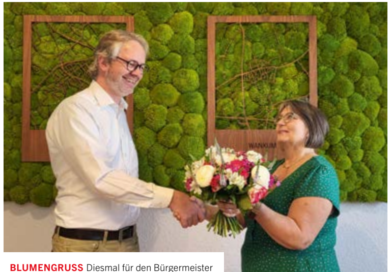
BLUMENGRUSS Diesmal für den Bürgermeister

Die Terminabsprache sowie die Anmeldung der Eheschließung erfolgt nach wie vor im Standesamt. Dort wird dann die Möglichkeit der Eheschließung durch den Bürgermeister geprüft. »Ich freue