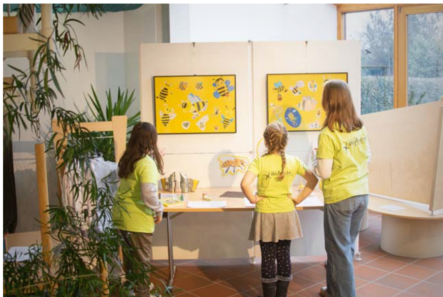
SIEH AN! Drei Weitsicht-Schülerinnen begutachten ihre Ausstellung.

Im Naturparkzentrum »Haus Püllen« wurde am Freitag, 27. Januar die Ausstellung »Die fliegenden Helfer« eröffnet. In der Ausstellung präsentieren Schülerinnen und Schüler der »Freien Realschule Weitsicht« in Wachtendonk ihre Arbeiten rund um das Thema Wildbienen. Plakate informieren unter anderem über die verschiedenen Arten von Wildbienen und was jede und jeder Einzelne für deren Erhalt tun kann. Eine selbstgebaute Niströhre erlaubt einen Blick in die sonst im Verborgenen stattfindende Entwicklung der Bienen. Mit künstlerischen Zeichnungen, einer mittels QR-Code aufrufbaren Geschichte, dem 3D-Druck einer Wildbiene und viel Anschauungsmaterialien ist es den Schülerinnen und Schülern gelungen, einen umfang- und lehrreichen Einblick in das Leben dieser für uns so wichtigen Insekten darzustellen. Die Ausstellung wird noch bis zum 23. April 2023 gezeigt.