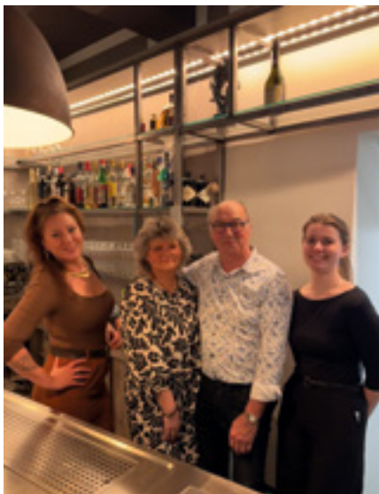
Genuss pur Abwechslungsreiche Küche und gemütliche Atmosphäre in der Kostbar N°5.