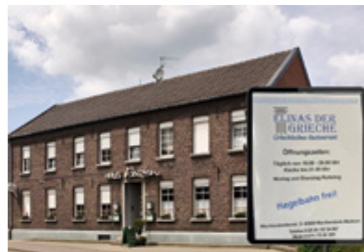
Elinas der Griechen Verwöhnt seine Gäste nun in Wankum im traditionsreichen »Haus Peuten«.

Die Übernahme sorgt dafür, dass der gastronomische Standort erhalten bleibt und weiterhin ein Treffpunkt für Bürgerinnen, Bürger und Gäste in Wankum ist. Gleichzeitig bereichert das neue Konzept das kulinarische Angebot in der Gemeinde um mediterrane und griechische Küche.