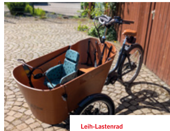
Leih-Lastenrad Auf Wunsch auch mit Kindersitz oder Maxi-Cosi-Halterung

Die Ausleihe erfolgt nach vorheriger Reservierung über die Plattform www.leihlastenrad.de . Abgeholt werden kann das Rad in der Tourist-Information Haus Püllen. Die maximale Nutzungsdauer beträgt sieben Tage.